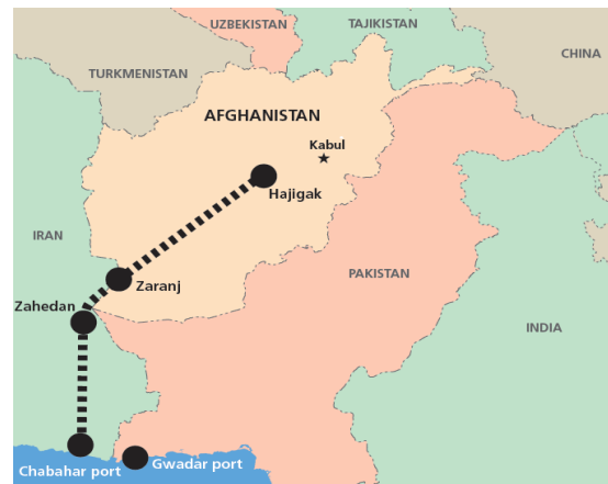
Figura 2. Puerto de Chabahar y ruta de acceso a Afganistán.

La caída de los talibanes en el año 2001 brindó a Irán una magnífica oportunidad para mejorar sus relaciones con su vecino del Este. En la época de los talibán, a finales de los noventa, el acoso a la minoría chií fue en aumento. Acusados de apóstatas, los chiitas fueron objeto de matanzas y persecuciones que llegó a su punto álgido en 1998 en Mazar-e Sharif, cuando nueve diplomáticos iraníes fueron asesinados, además de unos 2000 hazaras, a manos de los talibán. Esto puso en jaque al gobierno de Teherán llevando a ambos países al borde de un conflicto armado 12 . La hipotética vuelta de un grupo fun-