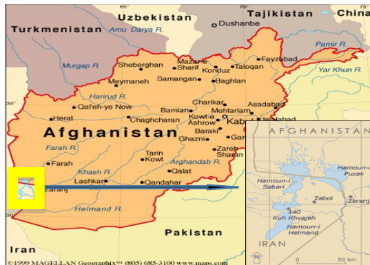
Figura 4: Principales ríos afganos desembocando en Irán.

reacciones por ambas partes que afecten a otros aspectos, como la crítica situación de los refugiados o ciertos tratados comerciales, con las pertinentes consecuencias negativas para las relaciones bilaterales.