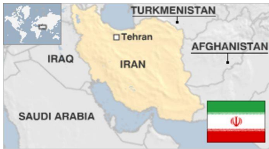
Figura 1. Irán y sus fronteras. Fuente www.BBC.com . Disponible en Internet: http://www.bbc.com/news/world-middle-east-14541327 {consultado en Diciembre 2014}